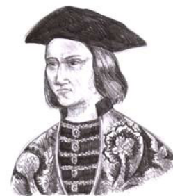
Edward Plantagenet Earl of March, Edward IV, 1442-83