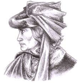
Richard Plantagenet Duke of York, 1411 –1460

Tous les territoires côtiers contiennent des ports mineurs, mais plusieurs contiennent un symbole de bateau qui désigne un port majeur. Les ports majeurs améliorent les mouvements maritimes (5.3).