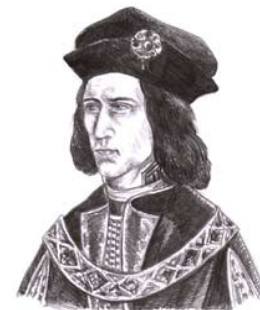
Richard Plantagenet Duke of Gloucester Richard III, 1452-1485

· Les blocs ne peuvent pas battre en retraite quand il est exigé qu'ils soient éliminés.