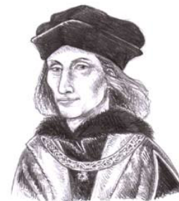
Henry Tudor Henry VII, 1457–1509

blocs York en Irlande, mais le bloc irlandais est absent, un bloc en exil est soumis à une perte d'1 force à chaque phase d'approvisionnement. S'il est toujours cumulé, un bloc en exil (au choix du propriétaire) va dans la réserve pendant la réinitialisation des Campagnes.