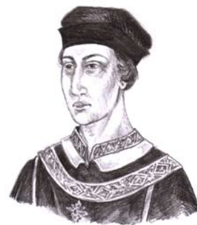
Henry of Lancaster Henry VI, 1421–1471

Répétez ces 4 phases jusqu'à ce que les 7 cartes aient été jouées.