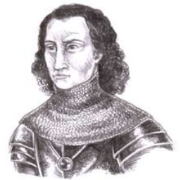
George Plantagenet Duke of Clarence, 1449-78

IMPORTANT : Les joueurs ne peuvent pas ajouter de force à des blocs existants pendant les phases de campagne.